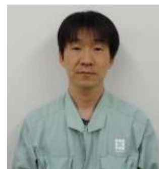
** ** (43歳) 管理部課長 管理担当