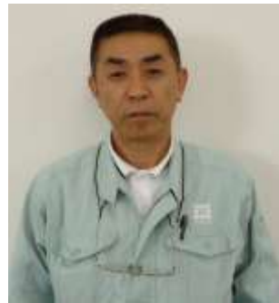
** ** (55歳) 取締役部長 製造担当