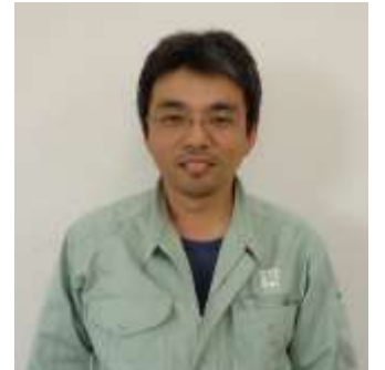
** ** (36歳) テクノ工場係長 テクノ工場担当