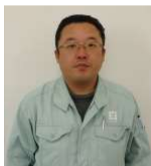
** ** (45歳) 取締役営業部長 営業担当