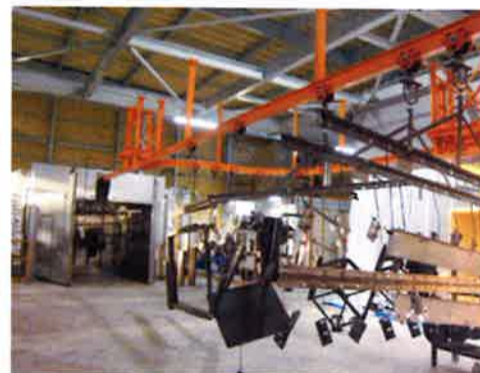
▲ 乾燥炉への輸送ライン