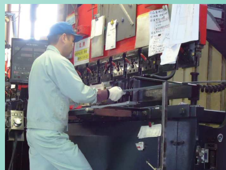
アマダ プレスブレーキ