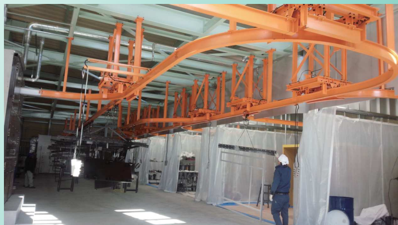
天井搬送ライン（塗装）