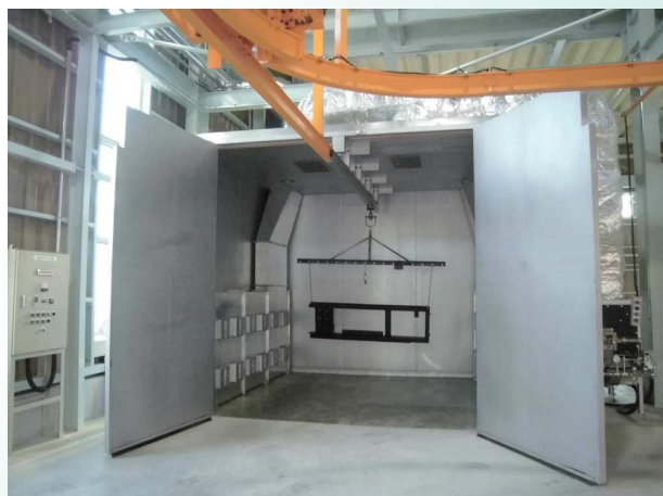
金庫型熱風乾燥炉