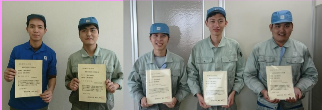
ヅ チュウ ヒュー タイン ホアン